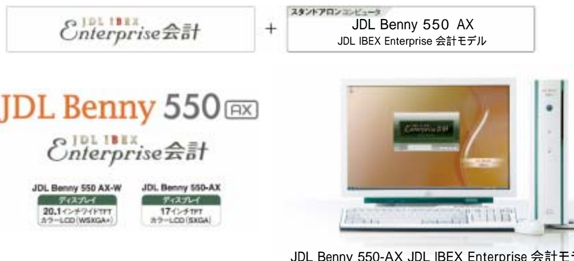
JDL Benny 550-AX JDL IBEX Enterprise 会計モデル