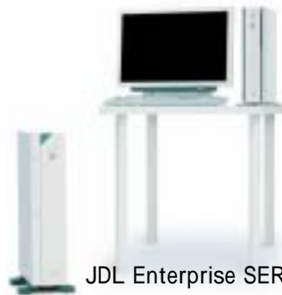
JDL Enterprise SERVER f